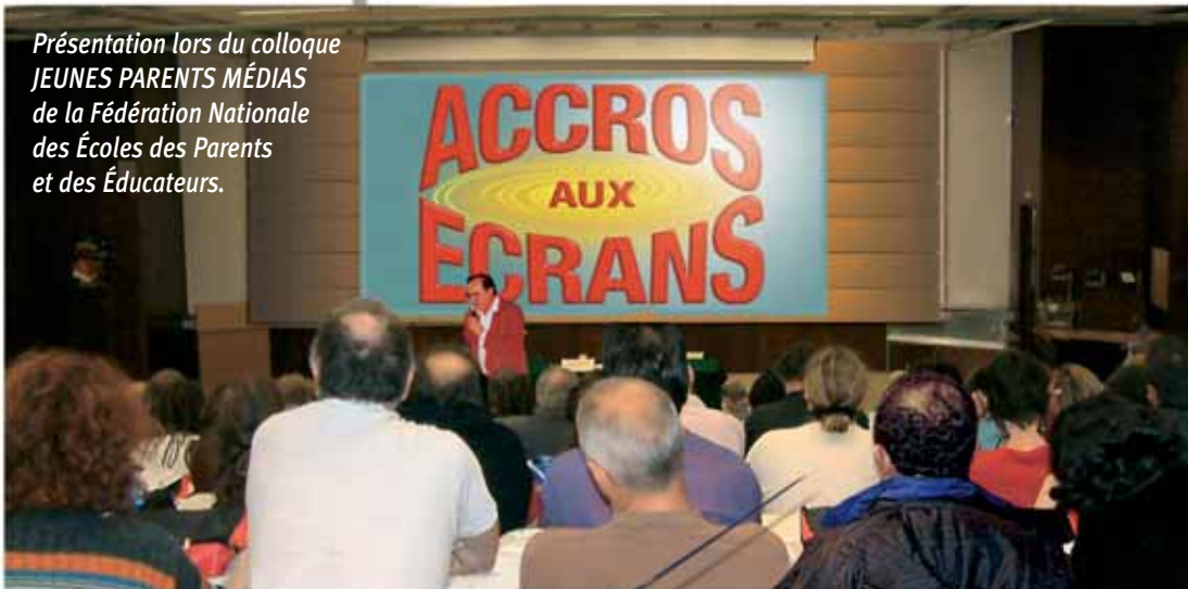
Présentation lors du colloque JEUNES PARENTS MÉDIAS de la Fédération Nationale des Écoles des Parents et des Éducateurs.

Numériques en Sciences Humaines (OMNSH), auteur de "Guérir par le virtuel" (Presses de La Renaissance).