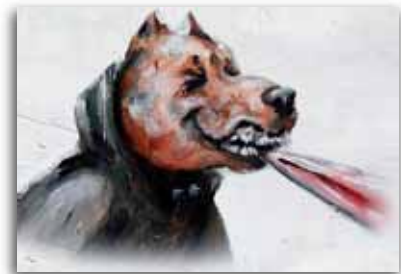
Soucieux d'éviter toute stigmatisation, l'illustrateur a choisi de présenter le harceleur sous les traits d'un Pitbull, un molosse bien connu pour ne jamais lâcher prise... et il a imaginé les autres personnages avec des têtes d'autres chiens.