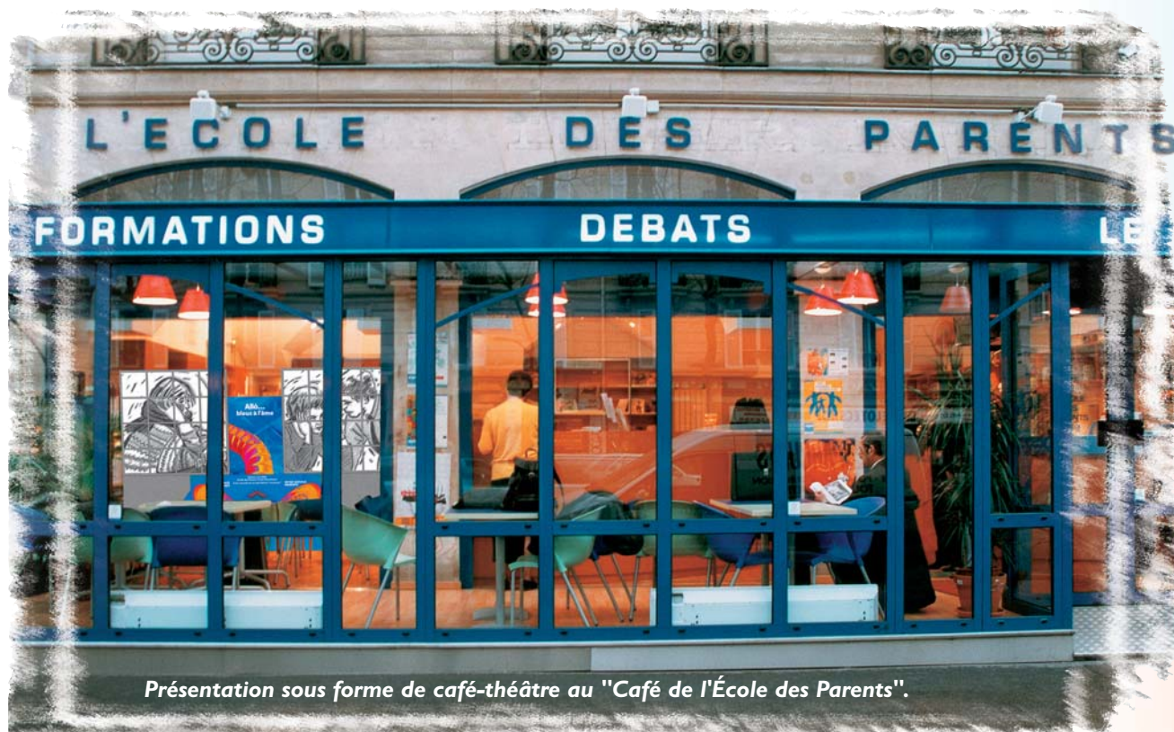
Présentation sous forme de café-théâtre au "Café de l'École des Parents".

Dédramatisant la situation, une chanson en rapport avec le thème évoqué est reprise en chœur au final de chaque séquence.